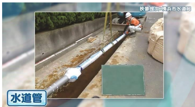
③ 家庭廻りの配水管