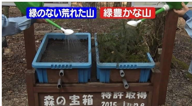
⑦ 水源林（実験の様子）