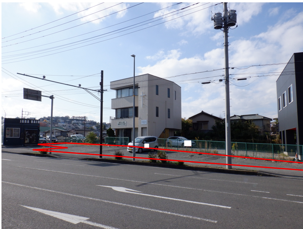
現地写真④（河原町駐車場）