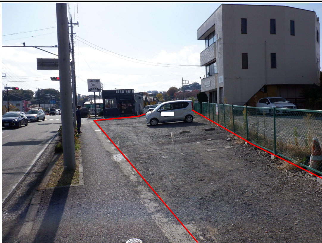
現地写真⑥（河原町駐車場）