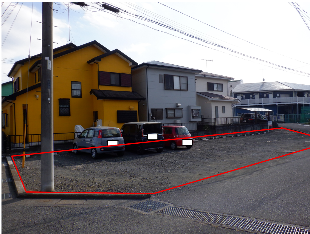
現地写真②（室町駐車場）